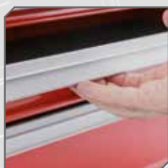
HLINÍKOVÉ RUKOJETI ZÁSUVEK